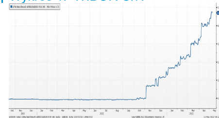
Wykres 1. WIBOR O/N

Dzisiaj kalendarz makroekonomiczny zawiera inflację za kwiecień z Niemiec, opis dyskusji na posiedzeniu węgierskiego banku centralnego oraz inflację i inflację bazową za kwiecień z USA.