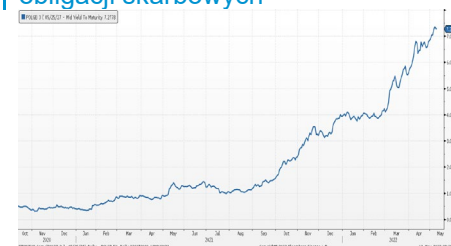
Wykres 2. Rentowność 5-letnich obligacji skarbowych